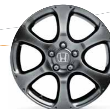
18" letmetalfælg med seks eger i mørkegrå udførelse.