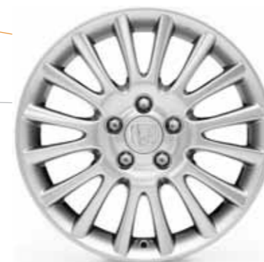
17" letmetalfælg med 16 eger

Udvalget af ekstraudstyr til den nye Civic er stort. Du finder mere ekstraudstyr i brochuren "Tilbehør til Honda Civic 5d" eller ved at gå ind på www.honda.dk .