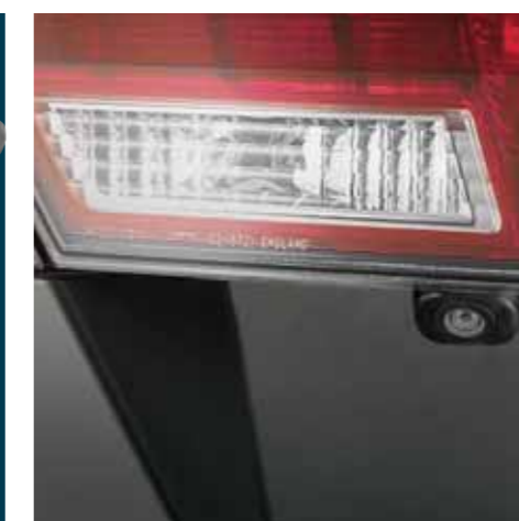
Det bagudvendte kamera viser billeder på navigationsskærmen, så du altid ved, hvad du har bag ved dig (fungerer kun på modeller med fabriksmonteret navigationsskærm)