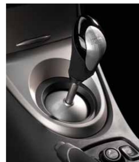
Gearknop i sporty perforeret læder og aluminium til både manuel og i-SHIFT gearkasse