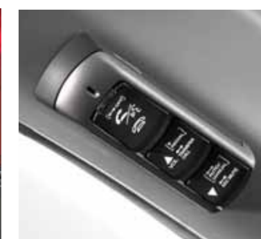
Bluetooth®-systemet – den mest nyskabende håndfri løsning til din telefon