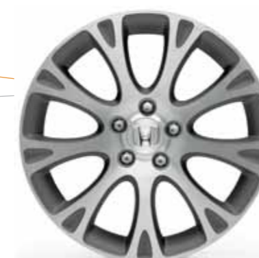
18" letmetalfælg i moderne design med ni eger.