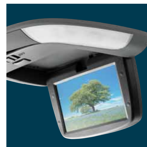
i-VES underholdningssystem med skærm og professionel lyd i bilen, cd- og MP3-kompatibelt med medfølgende høretelefoner