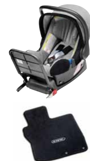
ISOFix-barnestol fra 0 til 13 kg (0-15 måneder) med ISOFix-monteringspunkter