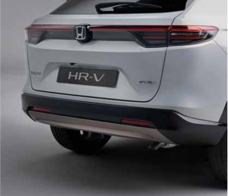
UDSMYKNING BAGPÅ FORNEDEN Udsmykning bagpå fornedden er standard på bilen og får Berlina Black-finish, og det optimerer fornemmelsen af kvalitet og bilens raffinement.