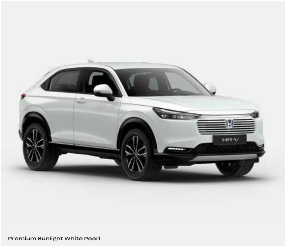
Premium Sunlight White Pearl