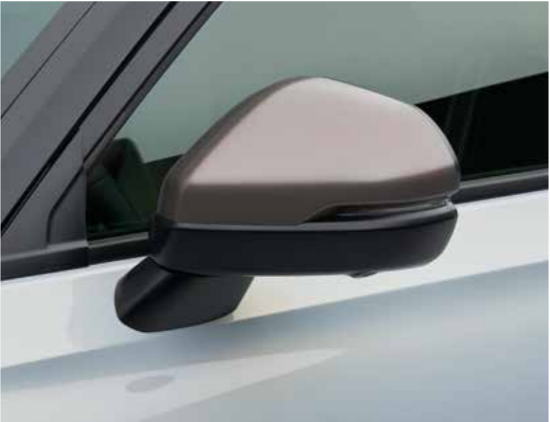
SIDESPEJLSOVERTRÆK Gør det lidt mere unikt med disse stilfulde overtræk til sidespejlene i Patina Bronze. Overtrækkene passer perfekt til din Honda.