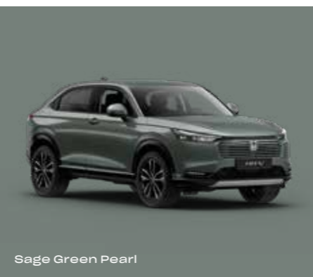
Sage Green Pearl