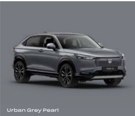
Urban Grey Pearl