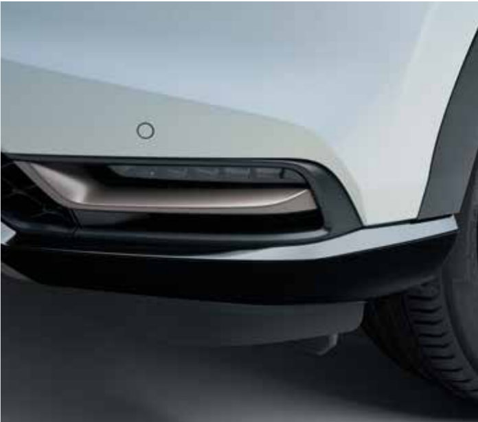
TÅGELYGTEUDSMYKNINGER Det drejer sig om de små detaljer. Disse Patina Bronze-tågelygteudsmykninger passer perfekt til den harmoniske styling af fronten på din HR-V.