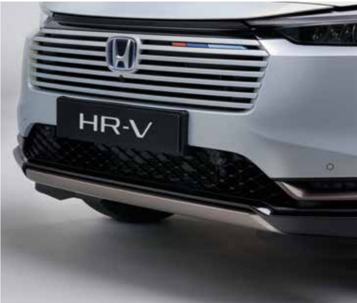
UDSMYKNING FORAN FORNEDEN Udsmykning foran fornedden er standard på bilen og får Patina Bronze-finish, og det optimerer fornemmelsen af kvalitet og din HR-V's raffinement.