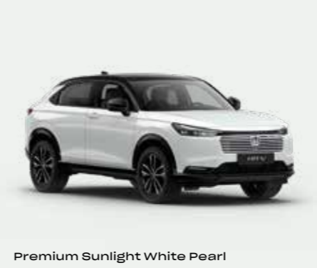
Premium Sunlight White Pearl