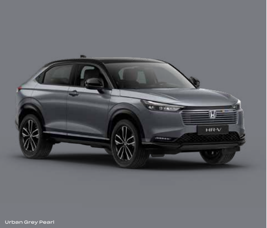
Urban Grey Pearl