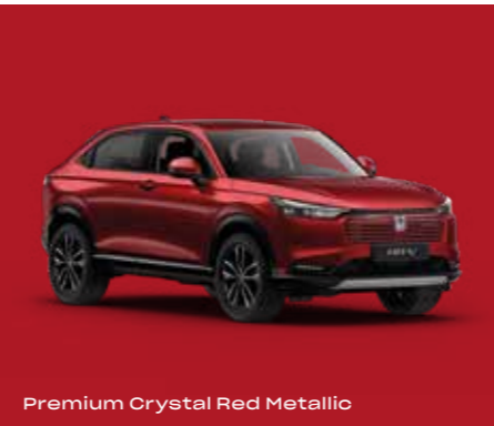
Premium Crystal Red Metallic