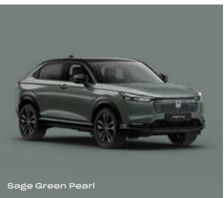
Sage Green Pearl