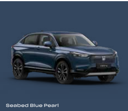
Seabed Blue Pearl