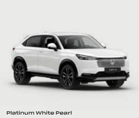
Platinum White Pearl