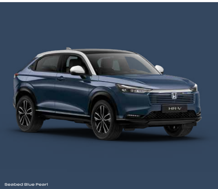
Seabed Blue Pearl