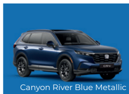
Canyon River Blue Metallic