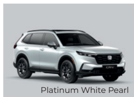
Platinum White Pearl