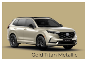
Gold Titan Metallic