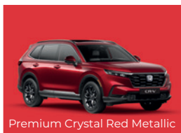
Premium Crystal Red Metallic