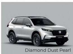
Diamond Dust Pearl