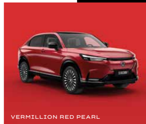
VERMILLION RED PEARL