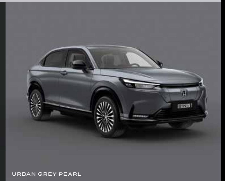
URBAN GREY PEARL

Den viste bil er Honda e:Ny1 Advance. Se specifikationerne på side 52-55 for at få flere oplysninger om, hvilket udstyrsniveau denne og andre funktioner findes på.