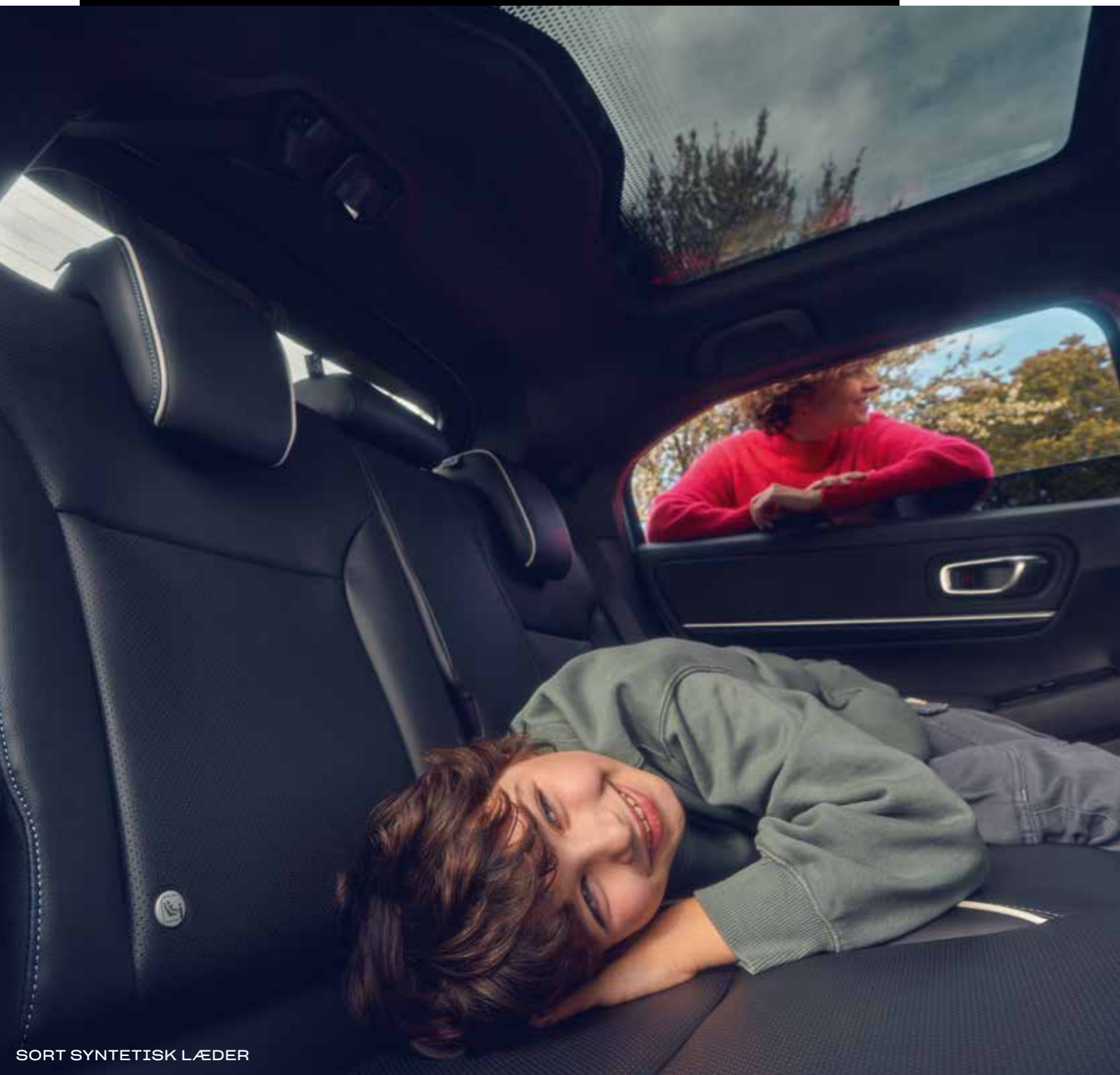
SORT SYNTETISK LÆDER

*Select grades and paint colours only. Den viste bil er Honda e:Ny! Advance i Aqua Topaz Metallic. Se specifikationerne på side 52-55 for at få flere oplysninger om, hvilket udstyrsniveau denne og andre funktioner findes på.