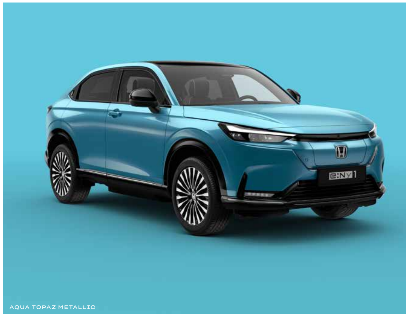
AQUA TOPAZ METALLIC

Vælg mellem en række moderne farver, der afspejler din personlighed og det dynamiske design af e:Ny1.