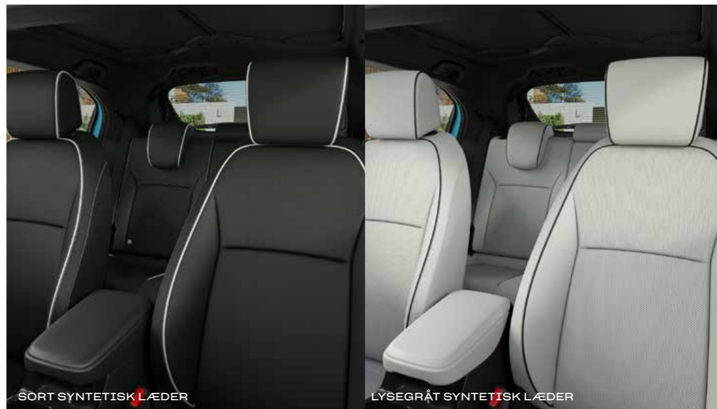
SORT SYNTETISK LÆDER