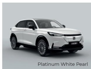
Platinum White Pearl