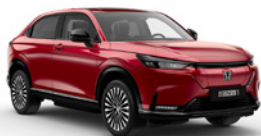
Vermillion Red Pearl