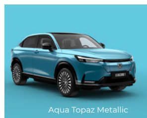
Aqua Topaz Metallic