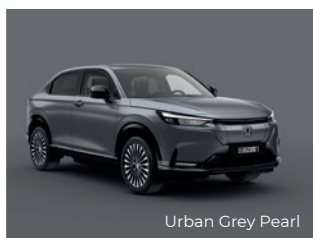
Urban Grey Pearl